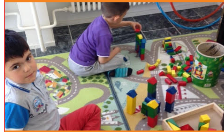
Kinder am spielen